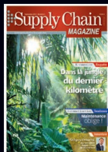
Magazine 10 numéros par an