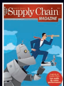
Hors série thématique