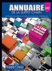
Annuaire des fournisseurs de la SC