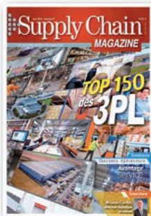
Magazine 10 numéros par an