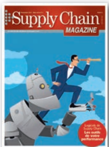
Hors série thématique