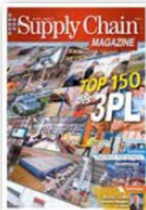
Magazine 10 numéros par an