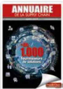
Annuaire des fournisseurs de la Supply Chain