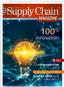
Hors série thématique