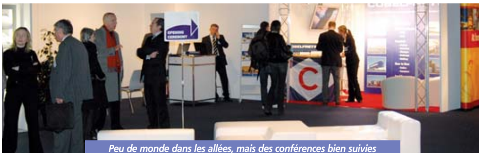
Peu de monde dans les allées, mais des conférences bien suivies

quelques français comme Transalliance et Sogaris. Pour ce qui est des conférences, un programme pédagogique et informatif sur la logistique au Luxembourg, la multimodalité, les 4PL, l'évolution du transport ou encore la formation en logistique. Avec une meilleure communication et une ouverture plus large sur de nouvelles familles d'acteurs (équipements, informatique, consulting...), cette première manifestation logistique pourrait se transformer en rendez-vous annuel, et devenir à terme, un véritable lieu d'échanges et de business. JPG