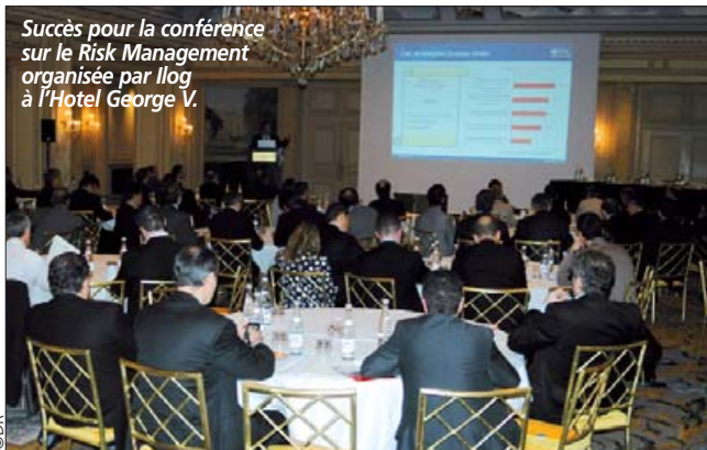
Succès pour la conférence sur le Risk Management organisée par Ilog à l'Hotel George V.

Directeur général adjoint de Geodis Logistics, a joué le rôle de « grand témoin » en expliquant comment son groupe appréhende le risque tant au niveau central qu'opérationnel. Pour tous ceux qui n'ont pu venir à cette présentation un débat « en live » vous sera proposé sur ce même sujet dans les prochaines semaines. Par ailleurs, une étude mondiale est actuellement en cours de réalisation dans le cadre de l'Observatoire de la Supply Chain