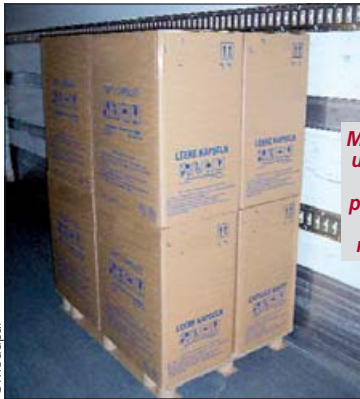
Modupal 70, une palette carton particulièrement résistante.

Elle s'appelle Modupal, pèse 6 kg et a été conçue par la petite société alsacienne Art Palette Système. Qu'est-ce