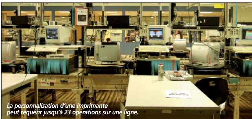
La personnalisation d'une imprimante peut requérir jusqu'à 23 opérations sur une ligne.

Logistic a créé plus de 10.000 emplois. Un succès qui tient à une vision très qualitative et très avant-gardiste de la logistique, mais aussi et surtout à une approche entrepreneuriale aux antipodes des logiques